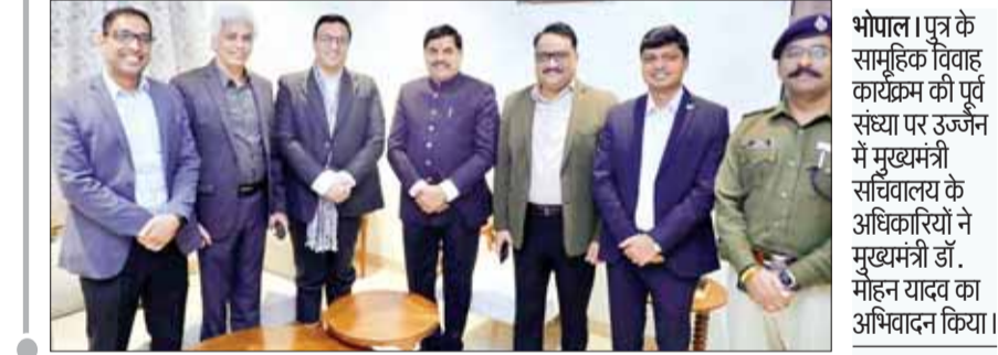
भोपाल। पुत्र के सामूहिक विवाह कार्यक्रम की पूर्व संध्या पर उज्जैन में मुख्यमंत्री सचिवालय के अधिकारियों ने मुख्यमंत्री डॉ. मोहन यादव का अतिवादन किया।